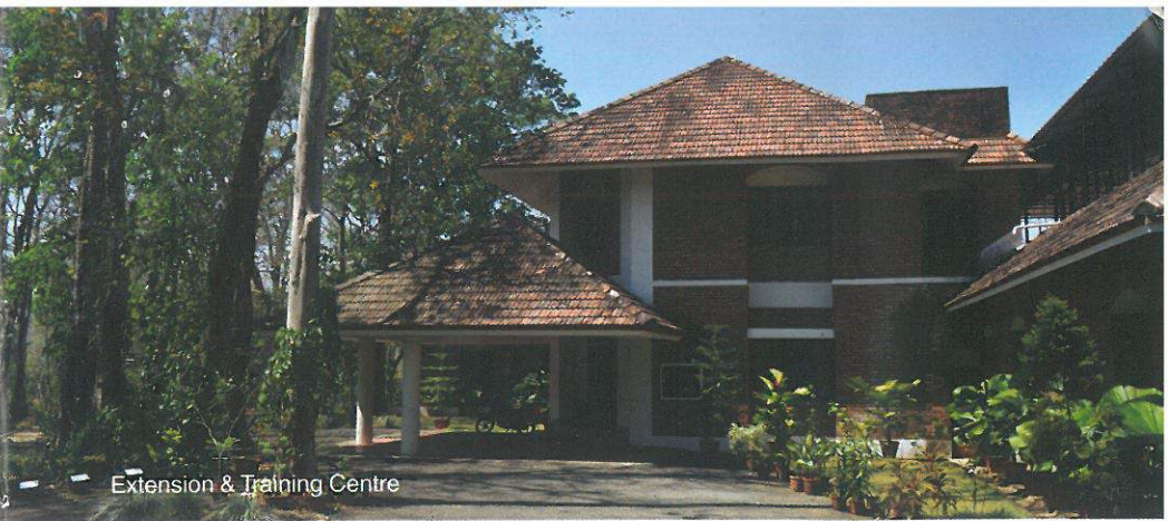
Extension & Training Centre